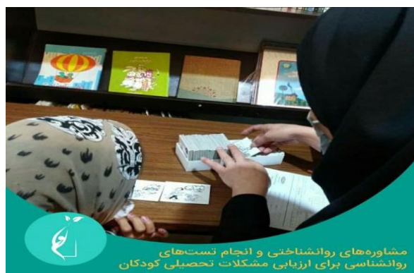
مشاوره‌های روانشناختی و انجام تست‌های روانشناسی برای ارزیابی مشکلات تحصیلی کودکان