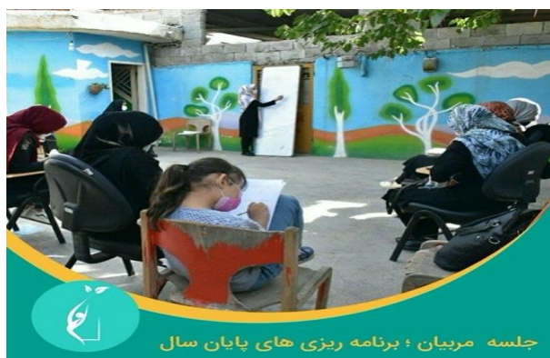
جلسه مربیان؛ برنامه ریزی های پایان سال

همچنین کلاسهای آموزش زبان انگلیسی برای دختران و پسران 9-14 سال در خانه کودک برگزار گردید که این کلاسها ادامه دارد.