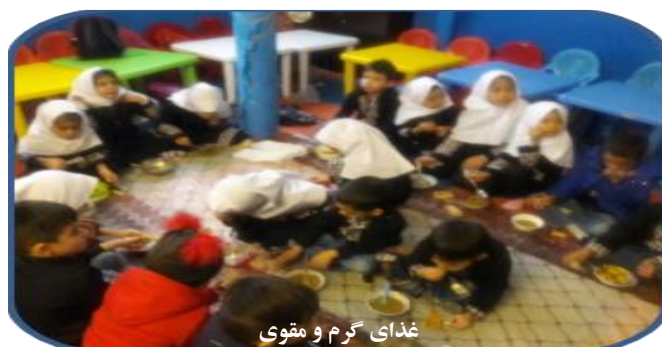
غذای گرم و مقوی