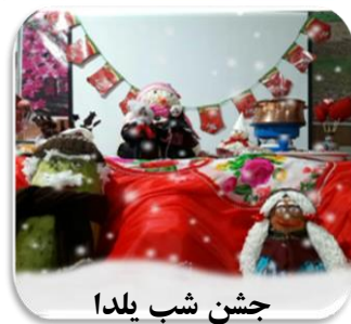
جشن شب یلدا