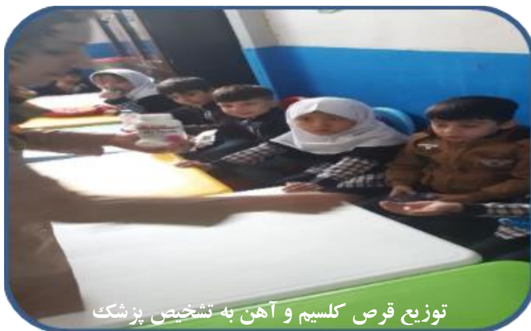
توزیع قرص کلسیم و آهن به تشخیص پزشک

در رابطه با اهمیت غذای مفید و نقش تغذیه به عنوان یکی از عوامل موثر در یادگیری کودکان نیز غذای گرم ( عدسی و لوبیا ) هر دو هفته یکبار توزیع شده است . همین طور با مشورت پزشکان متخصص اطفال کودکان هفته ای یکبار قرص کلسیم و ۲ بار شیر و به دختران نیز در برنامه سه ماهه آهن یاری هفته ای یکبار قرص آهن نیز داده شده است .