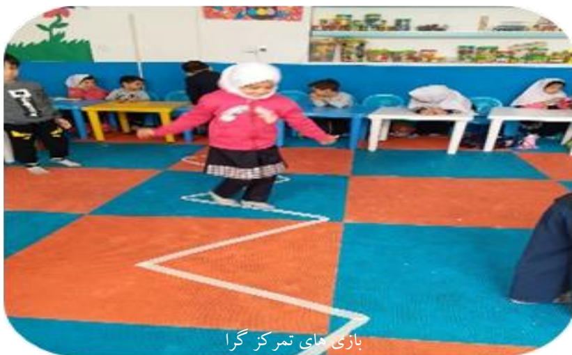
بازی های تمرکزگرا

برای تقویت تمرکز و مهارت های حرکتی در کودکان روز های چهارشنبه به بازی های هدفمند و تمرکزی اختصاص داده شده است.