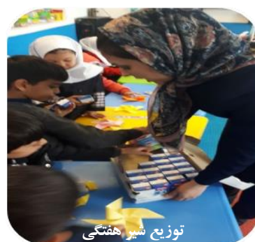
توزیع شیر همگنی